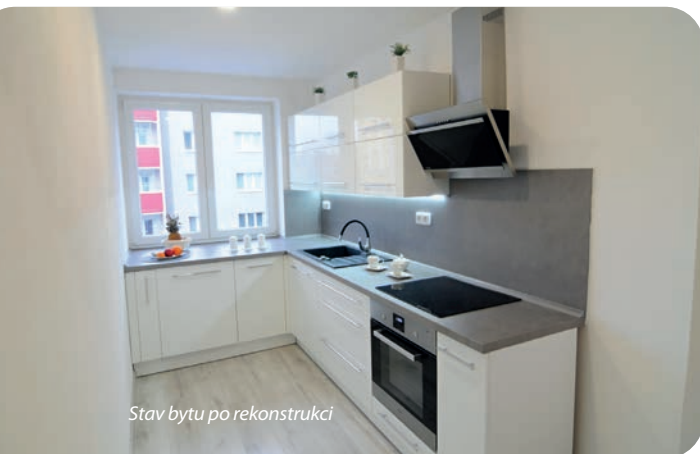
Stav bytu po rekonstrukci