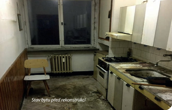
Stav bytu před rekonstrukcí