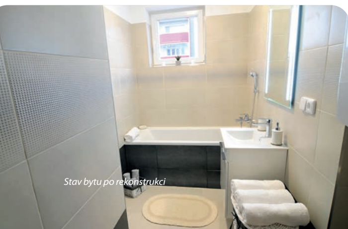
Stav bytu po rekonstrukci

Nakoupené nemovitosti následně připravujeme na budoucí prodej, aby byly pro zájemce atraktivní – vyklizení, malování, někdy situace vyžaduje částečnou nebo dokonce kompletní rekonstrukci.