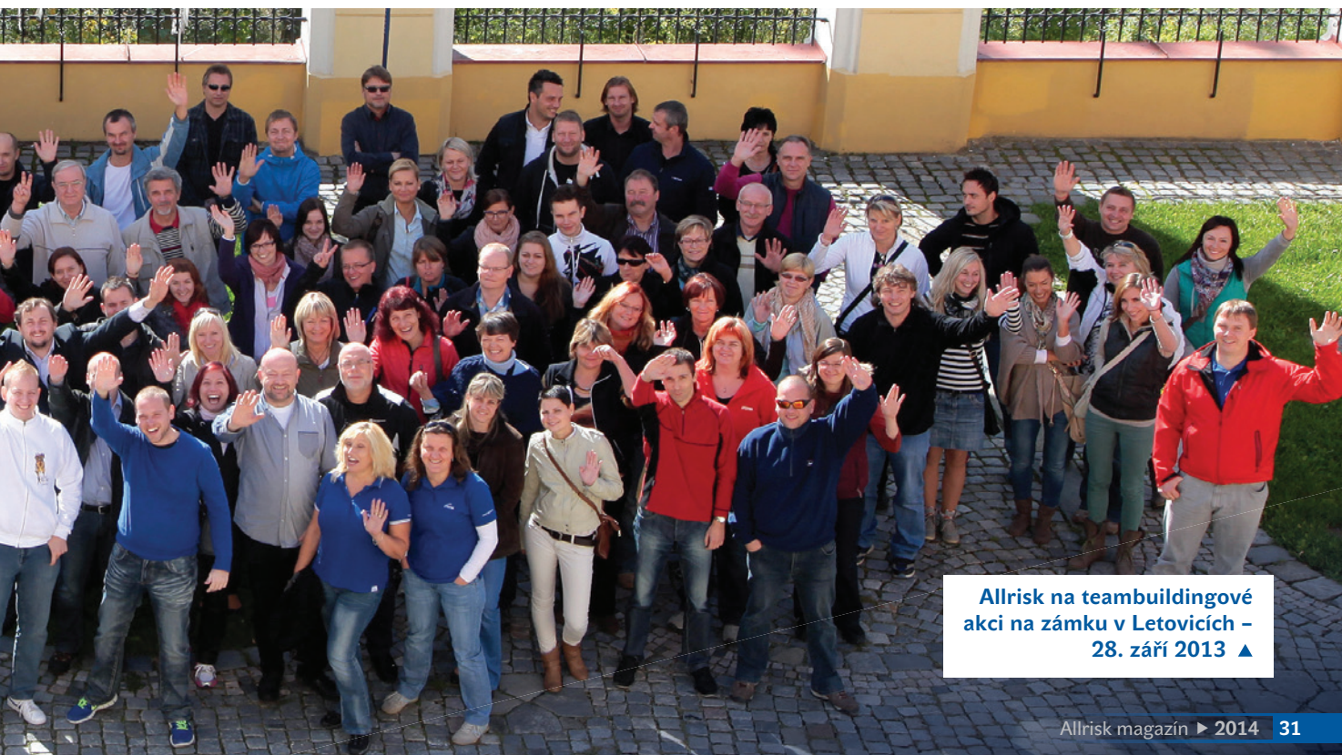
Allrisk na teambuildingové akci na zámku v Letovicích – 28. září 2013 ▲