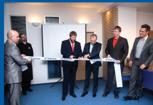
22 Nové klientské centrum