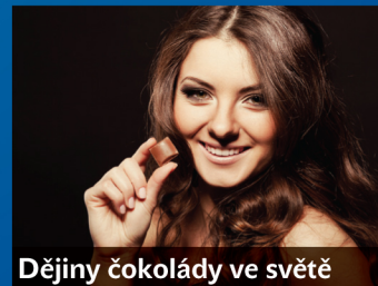
Dějiny čokolády ve světě